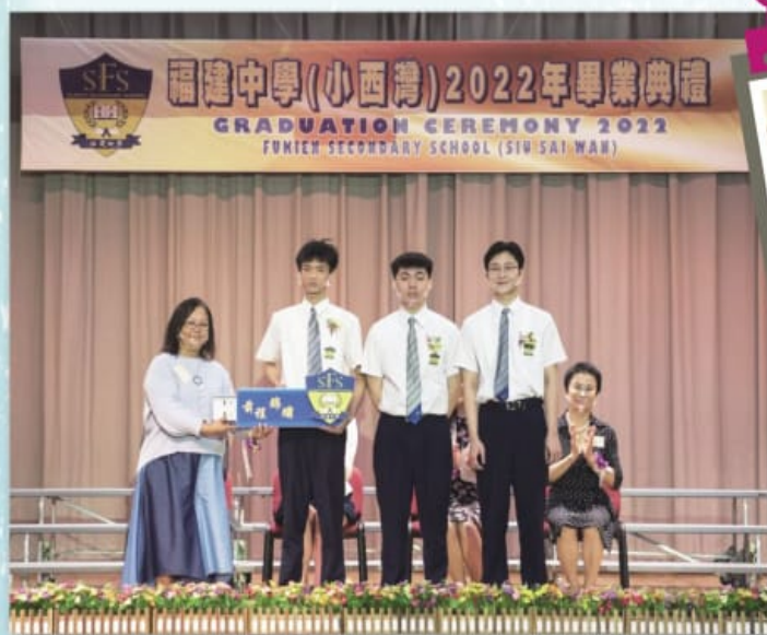
家教會主席送贈禮物給中六畢業生

這三年疫情肆虐，中六同學雖經歷不少停課日子，卻仍有不少中學生涯中難以忘懷的片段。為恭賀中六同學畢業，家教會特別為同學訂製以校徽作標誌的記憶棒，讓畢業班同學儲存校園生活片段，並於畢業禮這個富有紀念意義的日子，由家教會主席贈送予畢業同學。所謂「物輕情意重」，家教會期望藉此記憶棒永誌同學美好的校園生活點滴，並祝願同學前程錦繡，開展人生美好的新篇章。