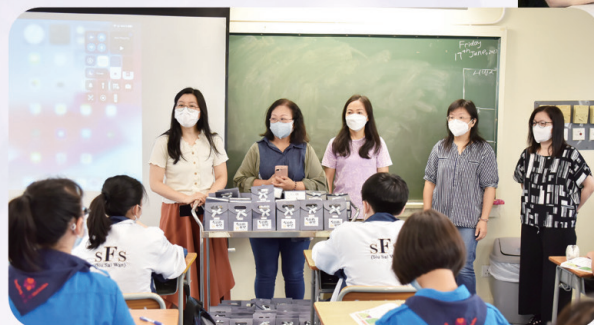
家長義工到課室派發父親節「茗茶禮包」