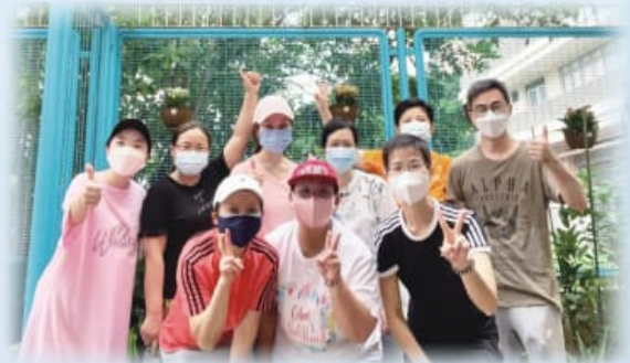
家長義工開心合照