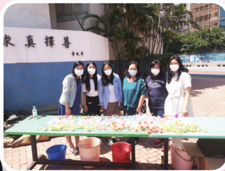
校長與家委一起派發鮮花