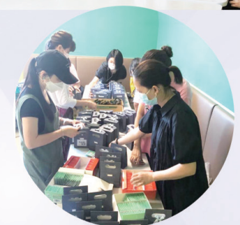
家長義工整理禮物包