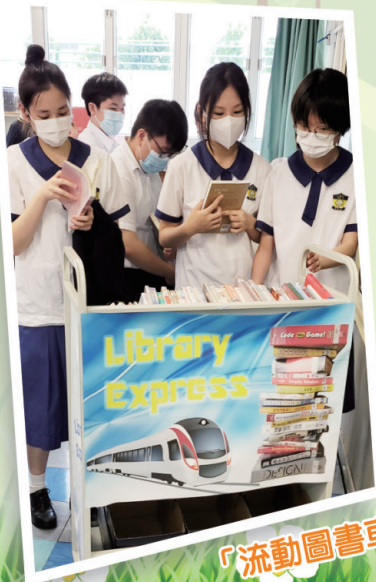
「流動圖書車」閱讀推廣活動

再次，本學年為實現「推動學生多元發展，培養學生積極向上生活態度和面對逆境時的自強能力，建立自信人生」這一目標，學校推出了「小福人動起來」、「BE A BETTER LEADER」、「小福造星運動」等活動，通過鼓勵同學們主動參與多姿多彩的課外活動，協助他們發掘個人潛能。輔導組組織同學們用寫欣賞卡的方式，鼓勵同學多關顧身邊的同學。課外活動組的老師們將品德教育與學校的常規活動相結合，例如在校慶歌唱比賽中帶出關愛的概念，引導同學們的社會責任感，在比賽的同時，又為香港的食物銀行籌措物資，支援疫情下需要幫助的人士。公民教育組的老師們則利用國慶活動日的主題研習活動，啟發同學關注環保，做個負責任的地球公民。下學期恢復實體課後，老師們立即為同學們安排了運動體驗日及班際閃避球比賽等活動，協助同學們重過正常的校園生活。