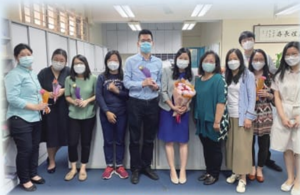
母親節「鮮花顯孝心」