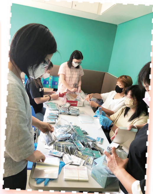
家長義工整理防疫小包